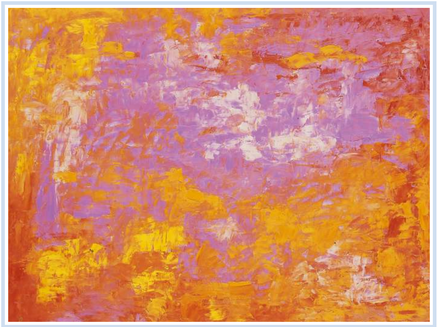
"I giorni delle cicale", 2004 Olio su cartoncino cm. 80x60

"Oggi ho dipinto un quadro, quasi un monocromo rosso...solo qualche sfumatura arancio e fucsia. Lo esporrò in vetrina, ben illuminato...Molta gente, passando, farà strani commenti... Si può commentare un'emozione?"