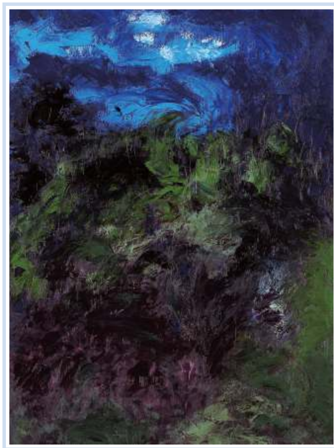
"Il bosco" , 2003 - Olio su cartoncino cm. 60x80