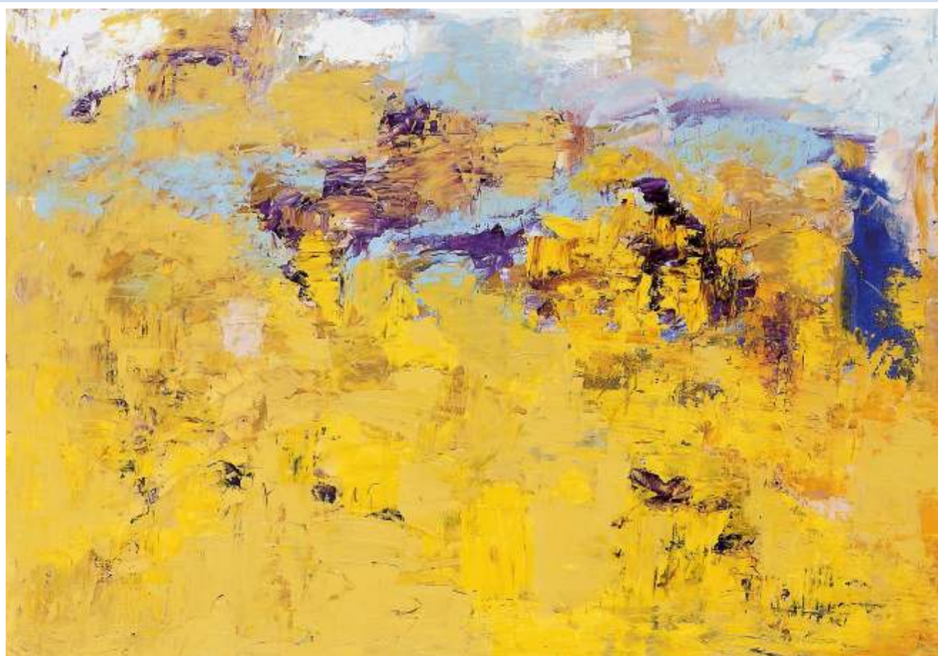
"Lo stagno", 2004 - Olio su cartoncino cm. 80x60

"Non sa l'uccello lusinghiero che mi sussurra parole d'amore.... vivrà solo fino all'alba...."