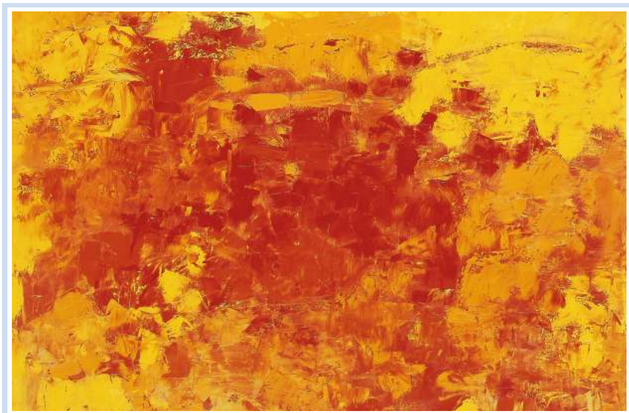
"Marina" , 2001 - Olio su cartoncino cm. 76x46

"E' calata la sera con tutto il suo fascino e il suo mistero. L'acqua scorre molto piano, quasi immobile come per farmi ricordare. Non voglio. E' passato molto tempo, troppo. Il sole infuocato non riscalderà i miei ricordi d'amore. E' tardi, troppo tardi. Niente è più come prima."