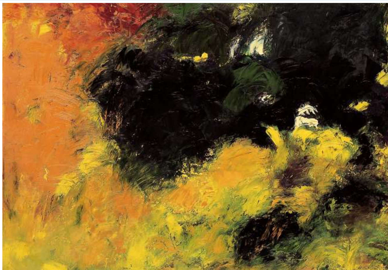
"Il bosco", 2003 - Olio su cartoncino cm. 80x60