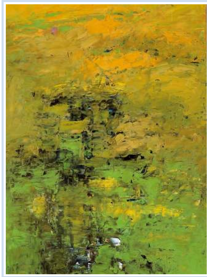
"Lo stagno" , 2002 - Olio su cartoncino cm. 33x53