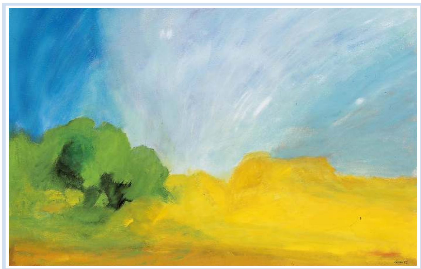
"Il bosco" , 2002 - Olio su cartoncino cm. 76x56 - (sfondo di copertina)

"Piccolo spirito, stai riposando su un fiore, sul glicine o su una spiga di lavanda o sulle foglie del pioppo vicino a casa. Vorrei tenerti nelle mie mani, vicino al cuore, ancora un poco, ora che stai morendo e il vento ti sta portando lontano. Piccolo spirito, amore infinito, resta ancora un respiro..."